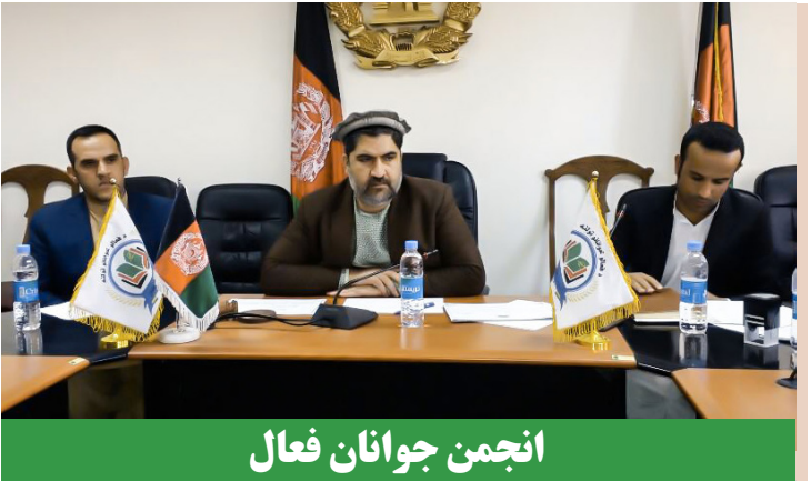
انجمن جوانان فعال

د زونو ځوانانو! پوهه او زده کړې خلاصون نه لري، کله چې یو ځوان ښوونځی ته ځي او یا پوهنتون ته ځي دا په دې مانا دی چې زموږ په ټولنه کې اوس هم ډېر ځوانان شته چې له پوهې سره مینه لري کله چې تاسو ښوونځی او پوهنتون خلاص کړ نو ستاسې زده کړې پای ته نه دي رسېدلې او باید دوام ورکړئ ځکه علم یو داسې سمندر دی چې پای نه لري نو پیاوړی ځوان هغه څوک دی چې خپلو زده کړو ته دوام ورکړي او خپلې ټولنې ته د پوهې له اړخه ګټه ورسوي. په درنښت الحاج محمداکبر ستانکزی په ولسي جرگه کې د لوگر ولایت استازی